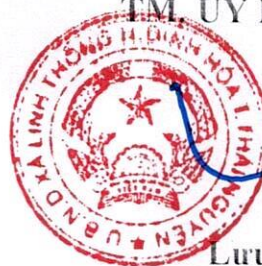
Lưu Viết Viên