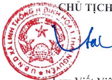
Lưu Viết Viên