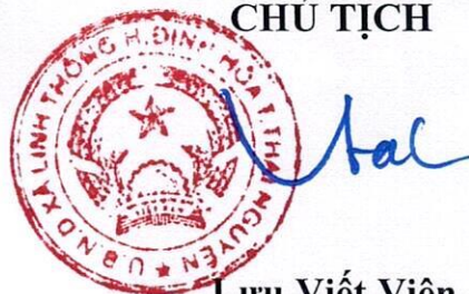
Lưu Viết Viên