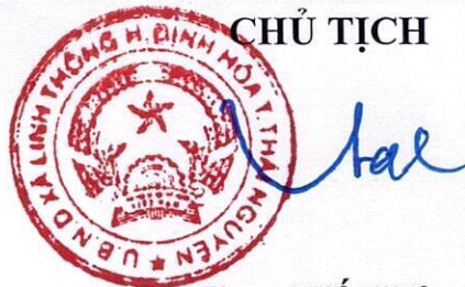
Lưu Viết Viên