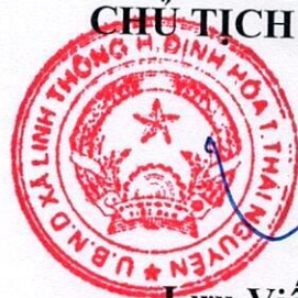
Lưu Viết Viên