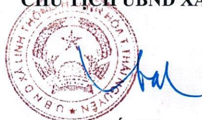
Lưu Viết Viên