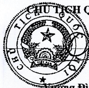
Wang Đình Huệ

Nghị quyết này được Quốc hội nước Cộng hòa xã hội chủ nghĩa Việt Nam khóa XV, kỳ họp bất thường lần thứ hai thông qua ngày 09 tháng 01 năm 2023.